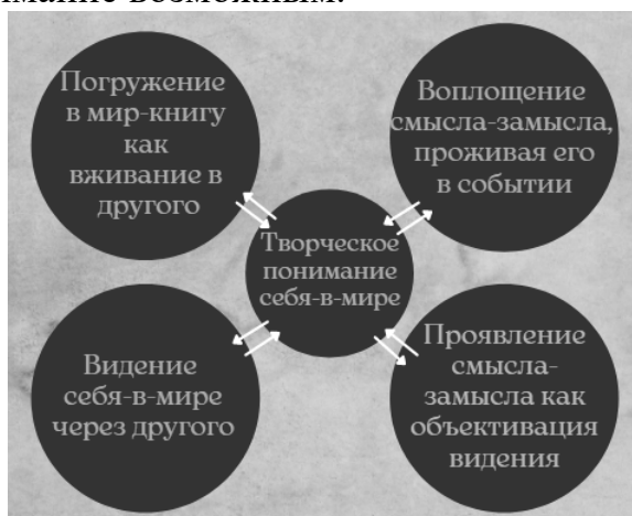
Рисунок 1. Отозваться актом-поступком - отстаивать индивидуальность

Путь к индивидуальности на модели сценического действия осуществляется в четырёх моментах творческого понимания себя-в-мире (см. рисунок 1) (по М.М. Бахтину [1]: вживание в Другого; видение себя-в-мире через Другого; проявление смысла-замысла как объективации видения; воплощение смысла-замысла, - испытанием его в событии) в процессе погружения в культуру, чтения-проживания, в котором человек становится автором и исполнителем своего высказывания-события. Эти моменты возможны только при творческом понимании себя-в-мире, но и, в то же время, именно они делают творческое понимание возможным.